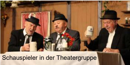
Schauspieler in der Theatergruppe